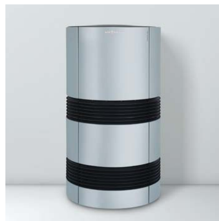
Vitocal 300-A für die Außenauflistung

Zusätzliche Einsparungen bei den Betriebskosten werden durch die Anbindung einer Photovoltaik-Anlage möglich. Der selbst erzeugte Strom kann zum Beispiel für den Betrieb der Vitocal 300-A verwendet werden. Zusätzlich ist die Vitocal 300-A vorbereitet für Smart Grid (intelligente Einbindung von Verbrauchern in die Stromversorgungsnetze).